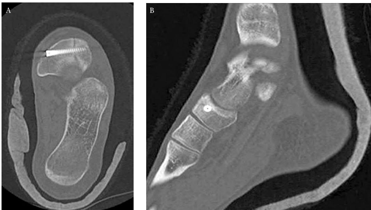
Fig. 3. TAC tras la reducción de la fractura con espacio interfragmentario menor de 1 mm.

consolidación ósea, por lo que se autorizó la carga total del miembro afecto, sin necesidad de usar ortesis. Durante las semanas ocho a 12 se realizó un trabajo alternativo en bicicleta, piscina y gimnasio, para empezar la carrera a pie al cuarto mes de forma progresiva.