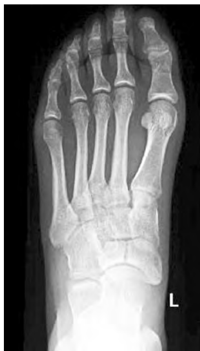
Fig. 1. Radiografía simple dorso-plantar, con fractura completa de tercio medio de escafoides y espacio interfragmentario de 2 mm.

Durante una sesión de entrenamiento, mientras practicaba carrera sobre pista, la paciente presentó un dolor brusco en el pie izquierdo que le dificultó la deambulacion. Acudió a nuestra consulta con tumefacción leve del mediopie, impotencia funcional y dolor a palpación en dorso de escafoides tarsiano. Con el diagnóstico de sospecha de fractura por fatiga se realizaron radiografías simples del pie, confir-